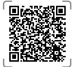
Mammobile en Haute-Garonne