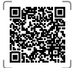
Vos centres de dépistage