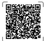
Modalités de prise en charge

Retrouvez qui à le droit de pratiquer un vaccin : https://www.service-public.gouv.fr/particuliers/vosdroits/F33924