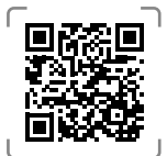
Mammobile dans le Gers