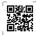
Mammobile en Haute-Pyrénées